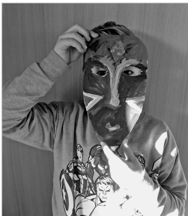
Výukový program Afrika.