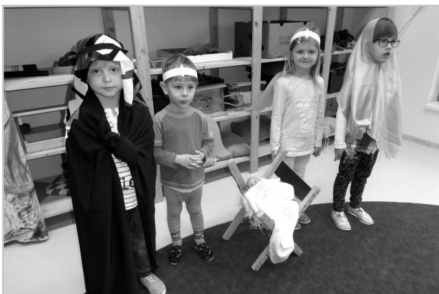
Tajemství Vánoc v Ekocentru Trkmanka.

Rok 2019 nám nadělil poměrně dlouhé Vánoční prázdniny, na které jsme se ve škole všichni bez výjimky už dlouho těšili. Proto jsme se snažili již v celém posledním předvánočním týdnu o navození příjemné atmosféry, aby nám ten zbývající čas rychleji uběhl. Pondělí jsme využili k doladění vánoční výzdoby a už v úterý si děti nastrojily stromeček. Asi se jim to moc povedlo, protože ve středu ráno je Ježíšek odměnil opravdu bohatou nadílkou. Ve čtvrtek jsme vyrazili