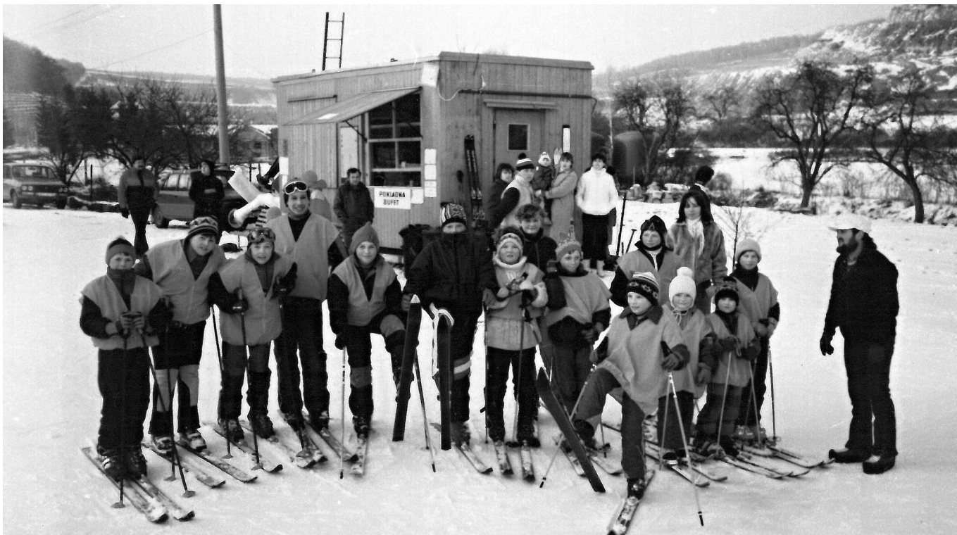
PRVNÍ UČEDNÍCI. Účastníci historicky prvního lyžařského kurzu pro děti před dvaatřiceti lety.