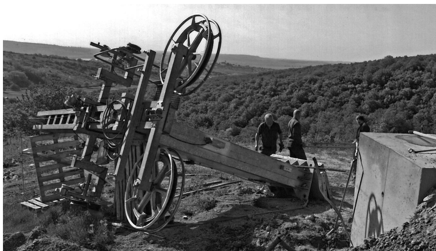
VÝŠ. Při navýšení horní části sjezdovky o metr a půl museli provozovatelé před osmi lety předělat i část vleku.

Vážení čtenáři, nejnižše položenou sjezdovkou ve střední Evropě se může chlubit Česká republika. Nachází se ve výšce pouhých 180 metrů nad mořem mezi vinicemi a meruňkovými sady v jihomoravských Němčičkách. A funguje už dvaatřicet let. Za tu dobu nadšenci z Němčiček, když to spočítali, naučili lyžovat kolem padesáti tisíc dětí. Až na výjimky na sněhu. Ten díky sněhovým dělům pokrývá němčičský svah s výjimkou části prosince i v letošní sezoně, která lyžování nepřeje.