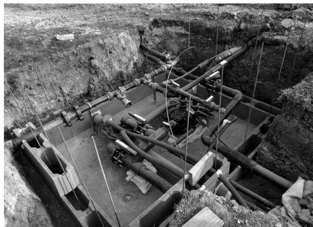
Výstavba nové šachty pro rozvody technologie dětského bazénu.