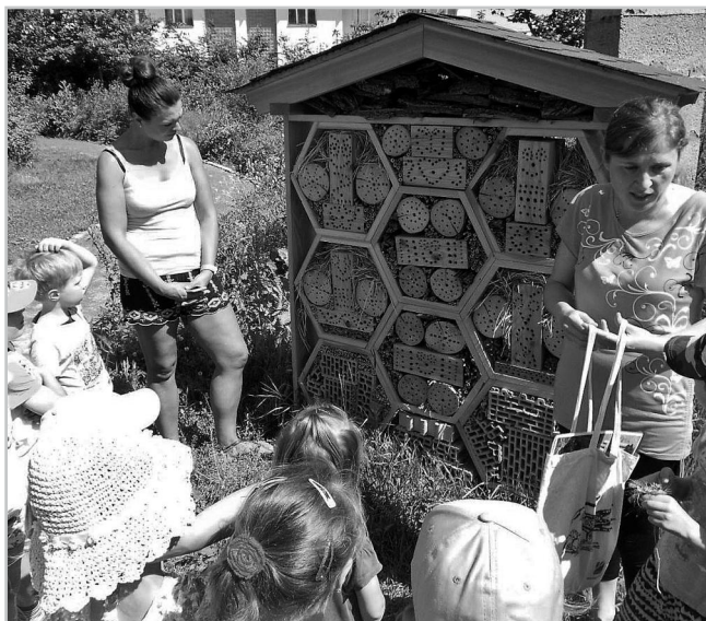
Výukový program Co se skrývá v trávě.