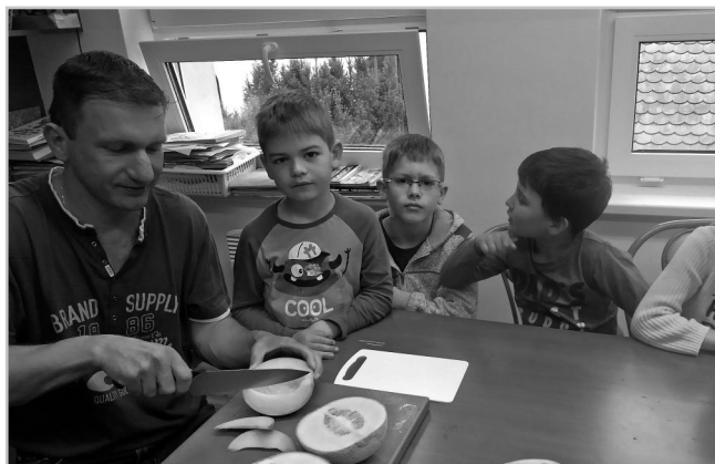
Projekt Ovoce do škol.