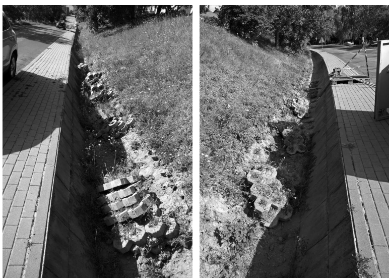
Obě fotografie: Zatrubnění příkopu pod Suchým řádkem.

• jak jsem již dříve psal, dostali jsme dotaci na zatrubnění příkopu pod Suchým řádkem. Je to sice jen 50 %, ale i tak se to vyplatí. Většinu prací provedou obecní zaměstnanci. Příkládám i 2 fotky ze zahájení prací. V době, kdy budete číst tento článek, bude již skoro hotovo. Rád bych znal Váš názor, zda na tento chodník umístit veřejné osvětlení? Váš názor mi můžete sdělit osobně na úřadě nebo mě kontaktujte prostřednictvím e-mailu, který najdete na stránkách obce.