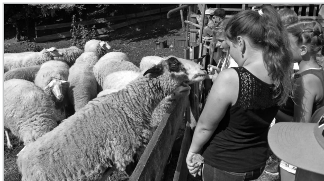
Návštěva Ovčích teras.