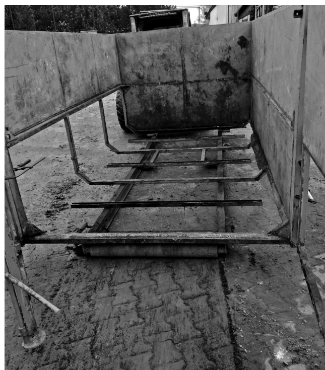
Generální oprava kontejneru našimi zaměstnanci.

V průběhu zimního období jsme prováděli rekonstrukci kuchyně v občerstvení a v klubovně penzionu na koupališti. Odstranili jsme staré schůdky na koupališti a nahradily novými z nerez. Po skončení