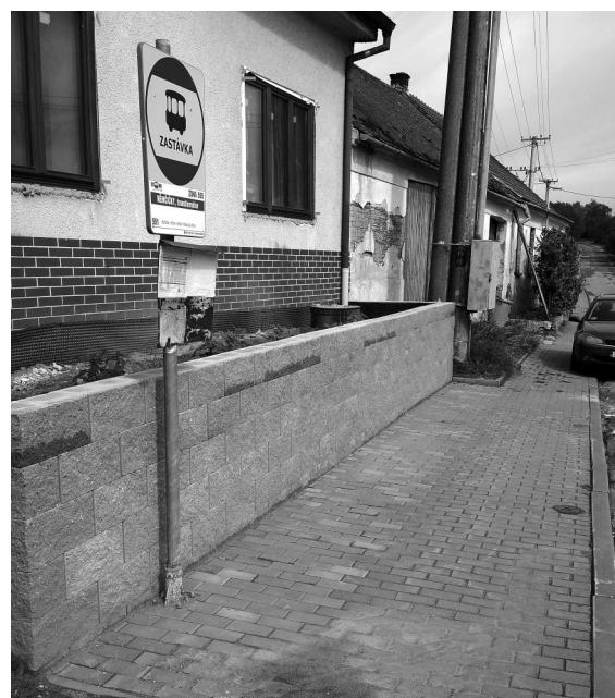
Zastávka na horním konci obce.

• jako další je rekonstrukce školy. Je to poslední etapa na vnitřní úpravy. Dále nás bude čekat jen venkovní plášť. O škole budu blíže informovat v dalším čtení.