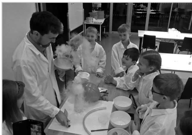
Pokusy ve Vida centru.