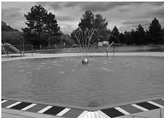
Dnešní podoba koupaliště.

Fotbalové hřiště sečeme, hnojíme, zavlažujeme.