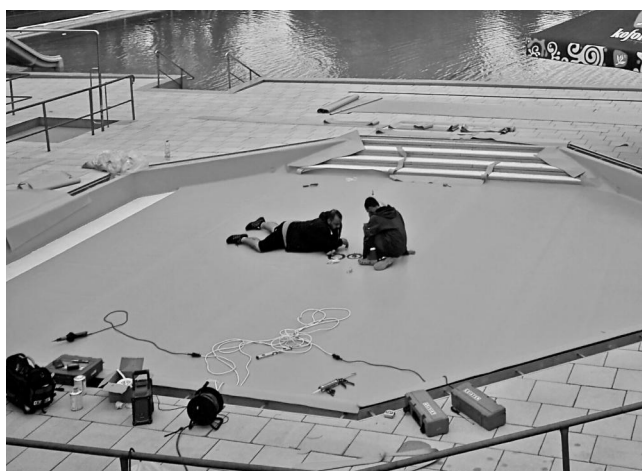
Lepení fólie téměř hotovo – zbývá osadit přepadové mřížky, zábradlí a atrakce.