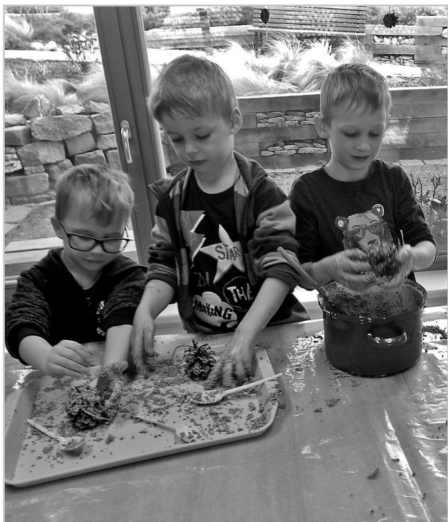
Vzdělávací program „I v zimě to žije“.