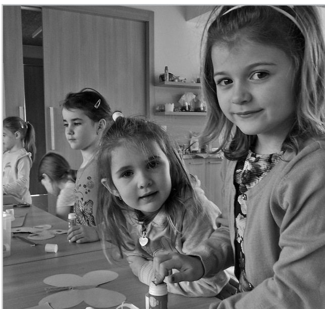
Program „Louka vypráví“.