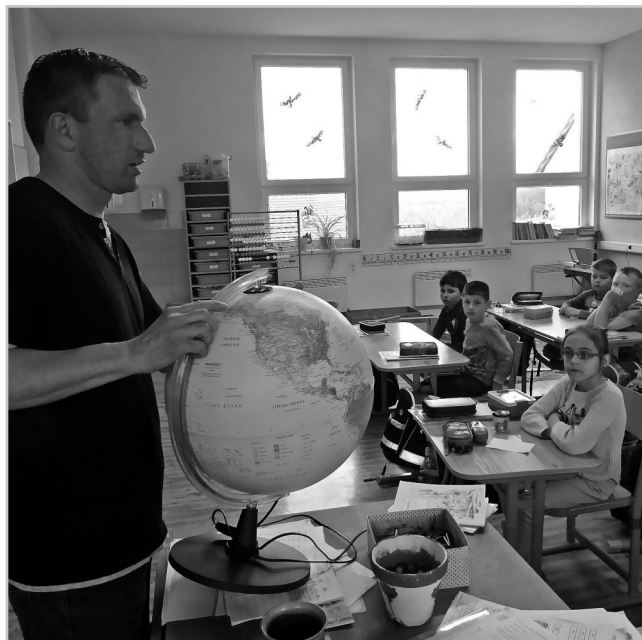
Oslava Dne Země.