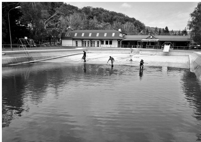
Příprava velkého bazénu.