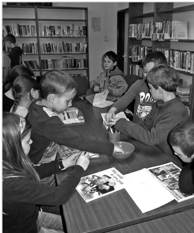
Březen – měsíc knihy aneb návštěva místní knihovny.