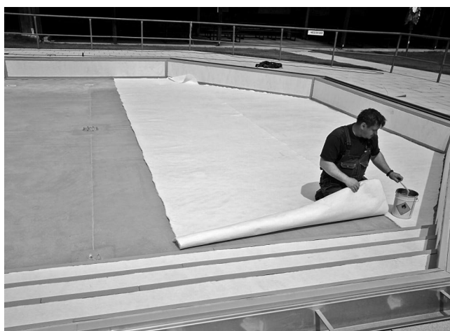
Dokončovací práce na malém bazénu – lepení geotextilie.

Tradičně v jarních měsících také proběhly další přípravy na letní sezónu. Velký bazén a technologie postupně prochází kontrolami a údržbou. Než se na začátku května začne napouštět voda, je třeba