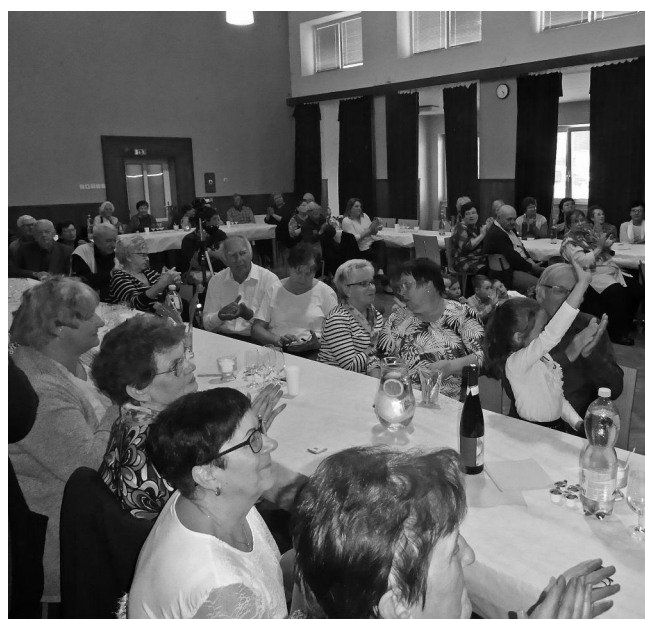
Obě fotografie – Beseda s důchodci.