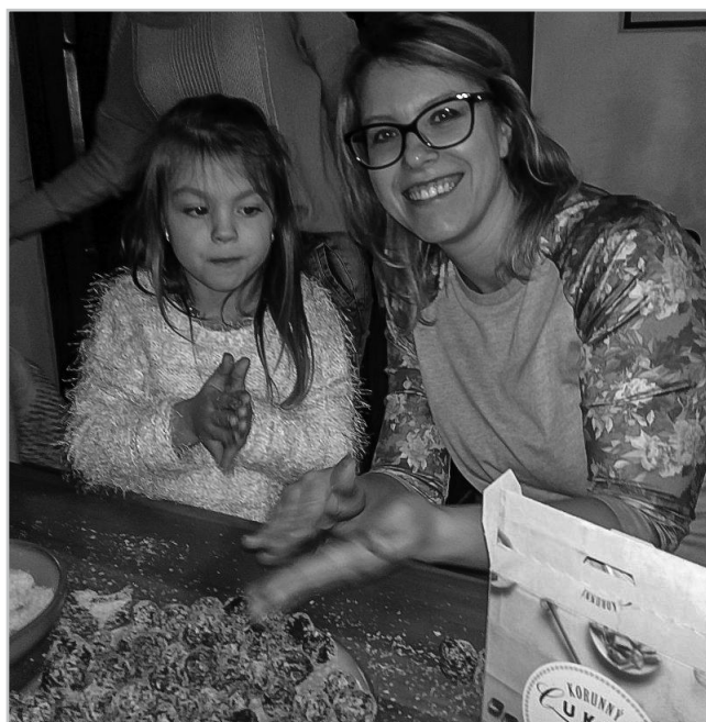
Výroba vánočního cukroví.