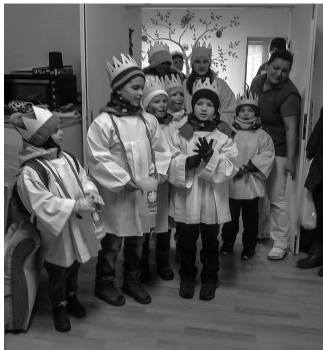
Tříkráloví koledníci na Domovince.