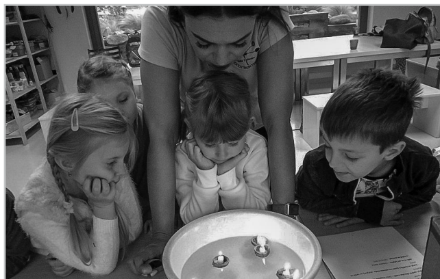
Tajemství Vánoc – pouštění lodiček.