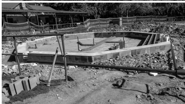
Foto nahoře – výkopové práce stroji TJ. Foto dole – postupné práce.