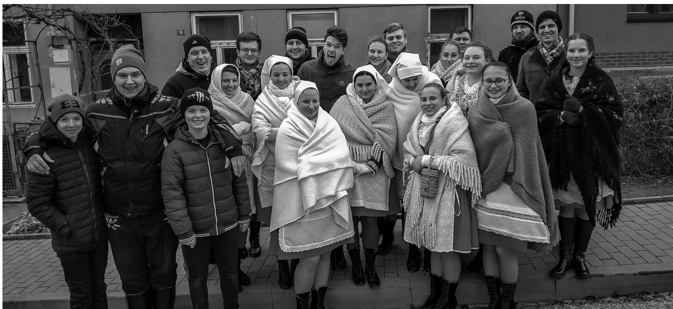
Krojování na Štěpána.