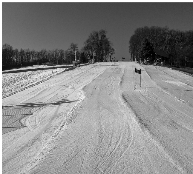
Lyžařské závody – trať.

Jako jedni z prvních u nás absolvují lyžařský kurz děti ze Základní školy v Krumvíři. Po skončení kurzu psaly