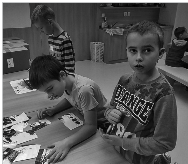
Výukový program Ekosystém lesa.