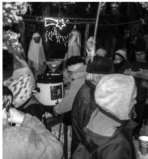
Občerstvení po koncertě u betléma.

Po koncertě bylo připraveno pohoštění, které se konalo u betléma vedle kostela. Přejeme Schole v dalším působení hodně úspěchů, a ať jim to co nejdéle vydrží.