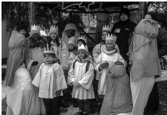
Tříkráloví koledníci u betléma.