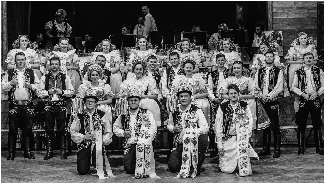
Krojování na plesu.