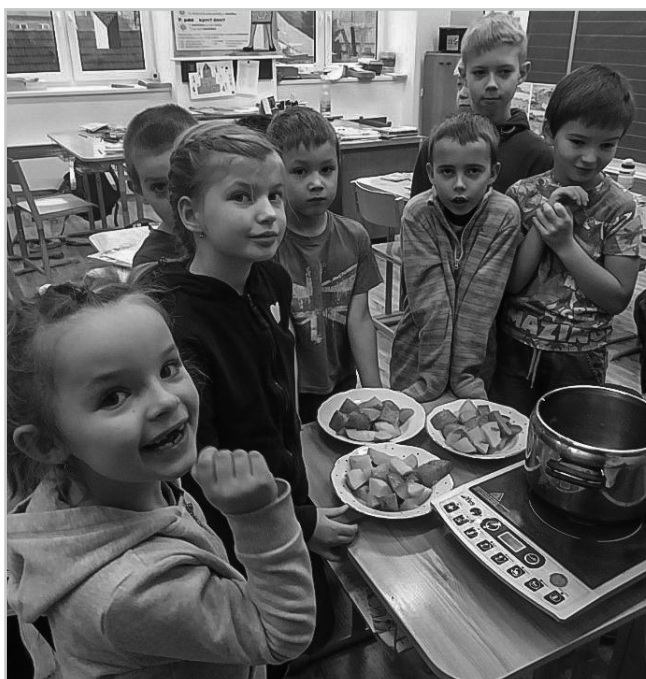
Bramborový den – ochutnávka vařených brambor.