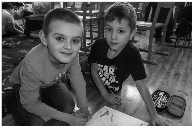
Projekt Zdraví dětem.