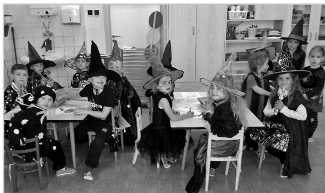
Čarodějnický rej ve školce.