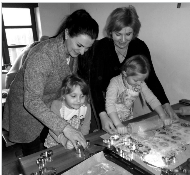
Pečení velikonočních perníčků na akci „Velikonoční zpívání pro varhany“.