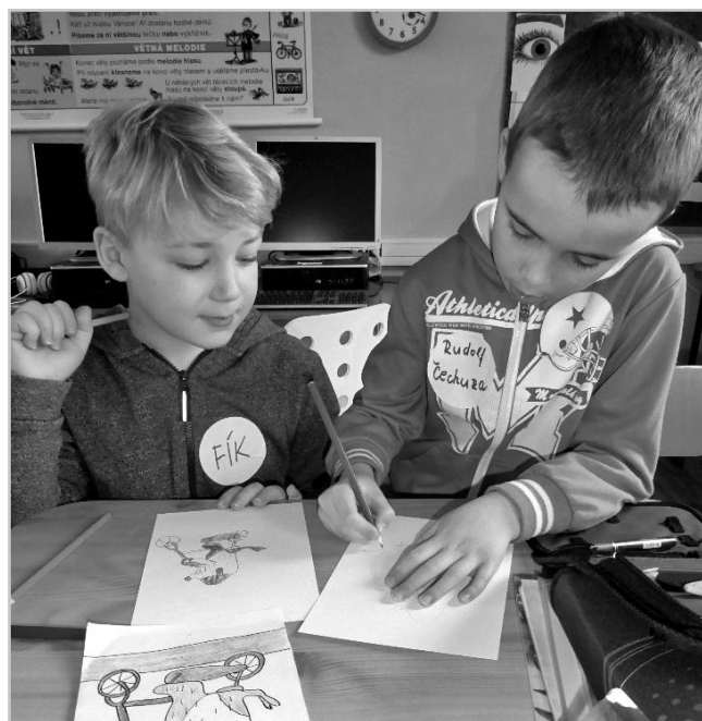
Březen – měsíc knihy.