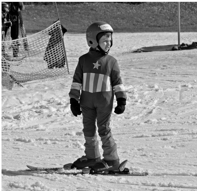
Maškarní karneval na lyžích.