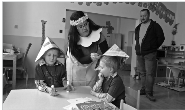
Zápis do 1. třídy základní školy.