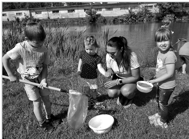
Co se skrývá ve vodní říši?