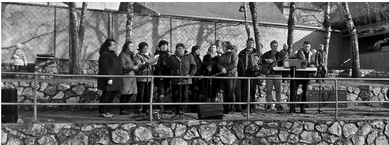
Vystoupení místního smíšeného pěveckého sboru.