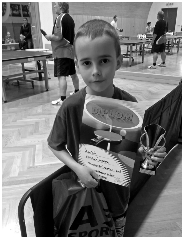
Děti na velikonočním turnaji.

Za kroužek stolního tenisu Pavlína Hyclová