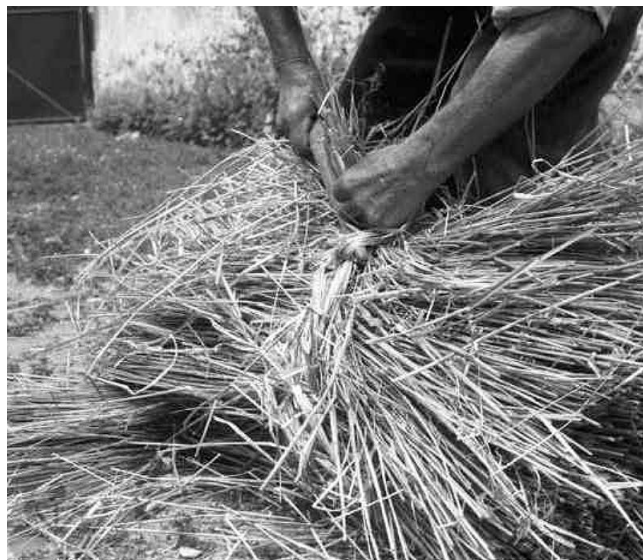
Vázání do snopu.

Až byla všechna úroda pod střechou, začalo mlácení. V dávnějších dobách se obilné snopy rozvázaly a rozložily na tuhou hliněnou zem. Pak přišly ke slovu cepy, kterými mlatici zrno z klasů uvolňovali. Byla to práce značně namáhavá a zdoluhavá. Pro správný