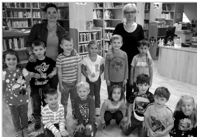
Děti z MŠ na výletě ve Vrbici.