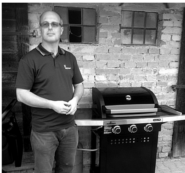
Pan farář s novým grilem.