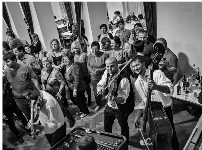
Košť mladých vín a svatomartinských hus – 18. 11. 2017.