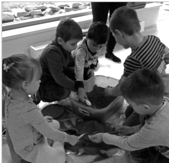
Jak se žije na kompostu v praxi.