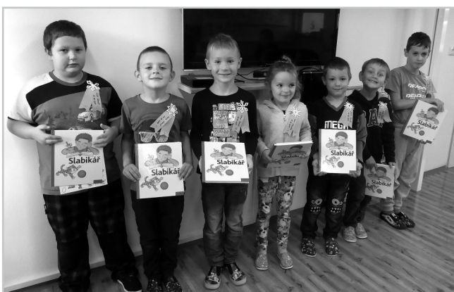
Prvňáci – čtenáři, 19. 10. 2017.