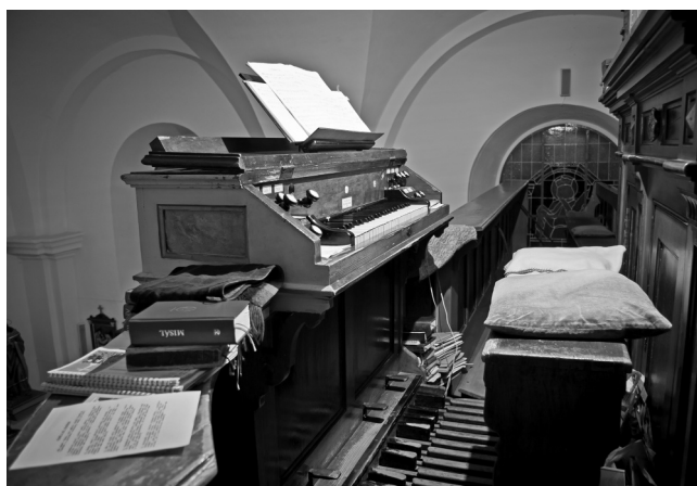
Varhany v místním kostele – hrací stůl.

Stálou součástí hracího stolu je manuálová klaviatura – slouží pro hru rukama a může jich být od jedné až do sedmi. Další součástí je zapínání rejstříků a spojek.