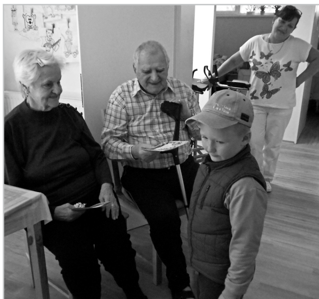
Oslava Dne seniorů.