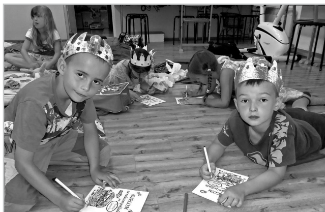
Pohádkové spaní ve škole.