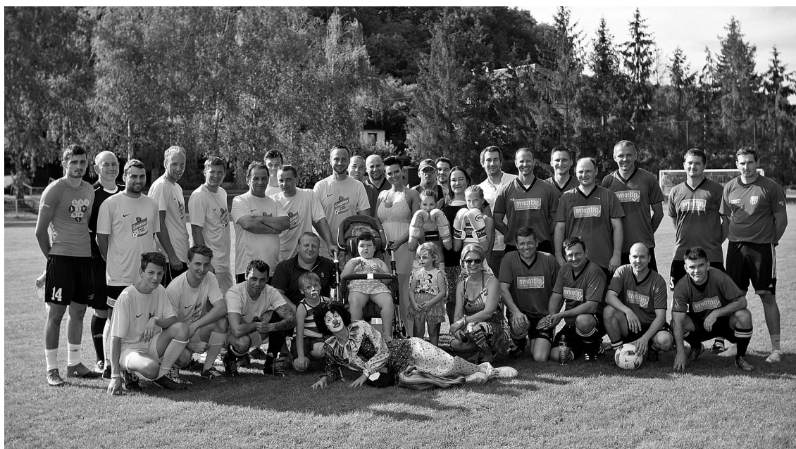
Anetka s rodiči a účastníci akce.