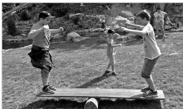
Den dětí na Arboretu.