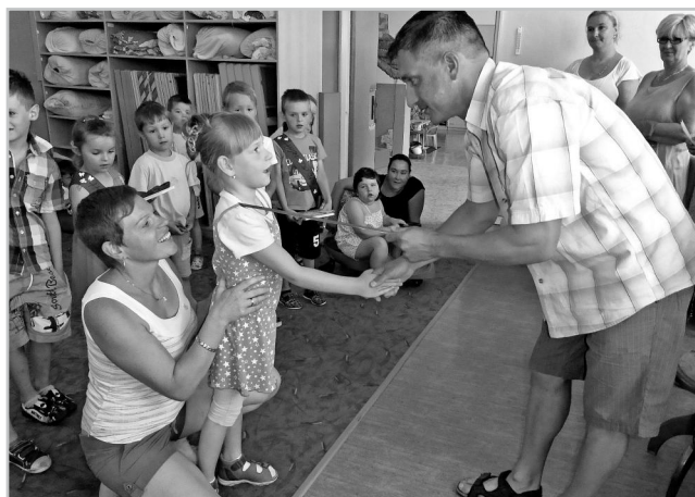
Pasování na prvňáčky.

Více fotografií ze školních činností naleznete na webu zs.nemcicky.cz/category/zpravodajstvi nebo na stránkách www.zonerama.com/skolanemcicky .