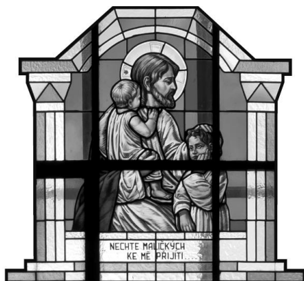
Okenní vitráž – „Nechte maličkých ke mě přijít...“