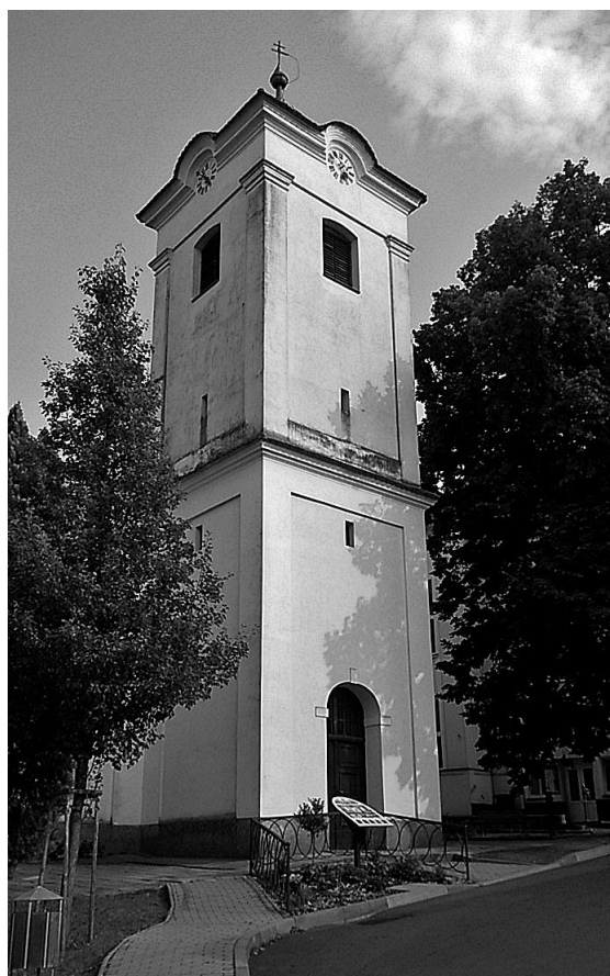
Nová tabule a osázení před kostelem.

Chtěla bych tímto poděkovat všem, kteří přispěli svou prací, materiálem, časem apod. ke zhotovení této tabule, taky za výzdobu kolem a hlavně dětem, které vyráběly dušičkové věnečky z jejichž výtěžku bylo dílo financováno.