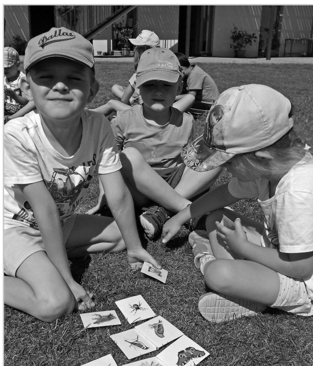
Děti z MŠ na programu „Rozkvetlá louka“.