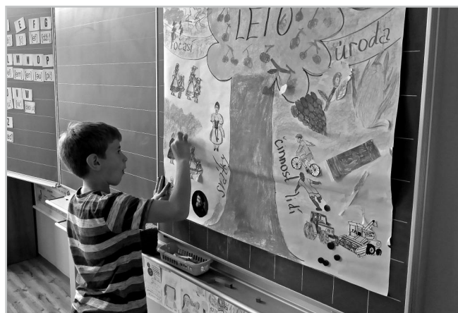
Tvorba letního stromu.