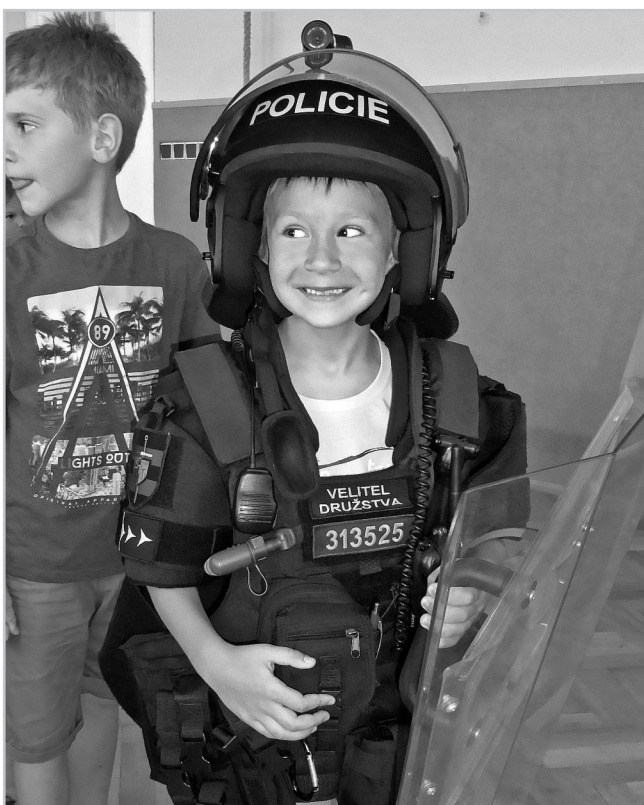
Zkouška policejní výzbroje.