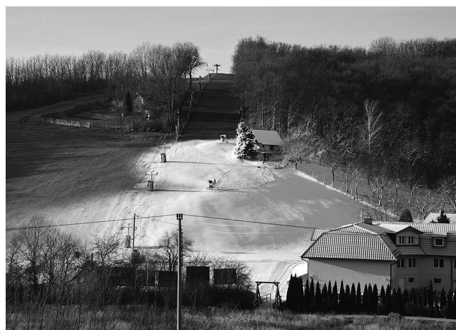
Lyžařský vlek – zasněžujeme.

Na obou budovách, které jsou postaveny před 13 a 15 lety, se v průběhu roku vyskytlo několik závad vyžadujících nutné opravy a modernizaci. Byly