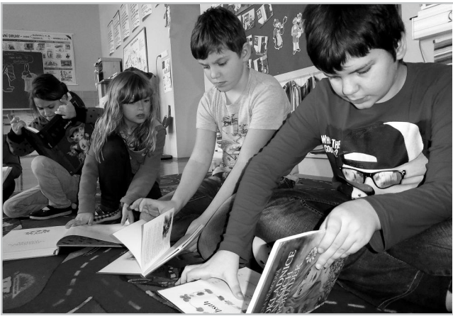
Březen – měsíc knihy.