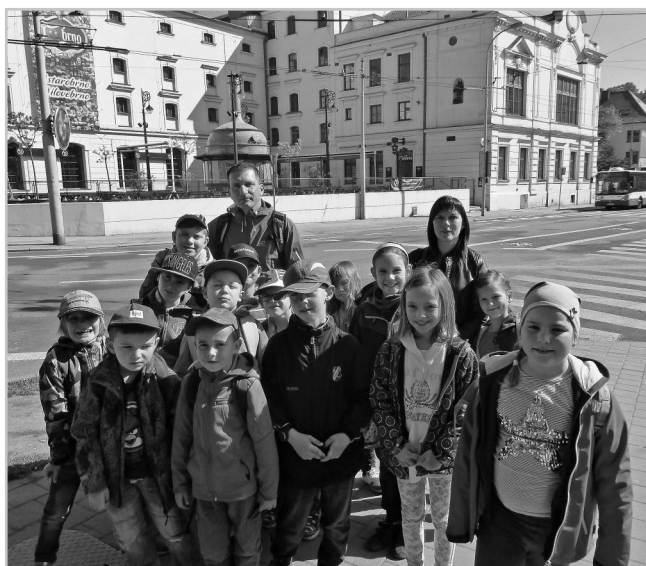
Školáci na výletě v Brně.