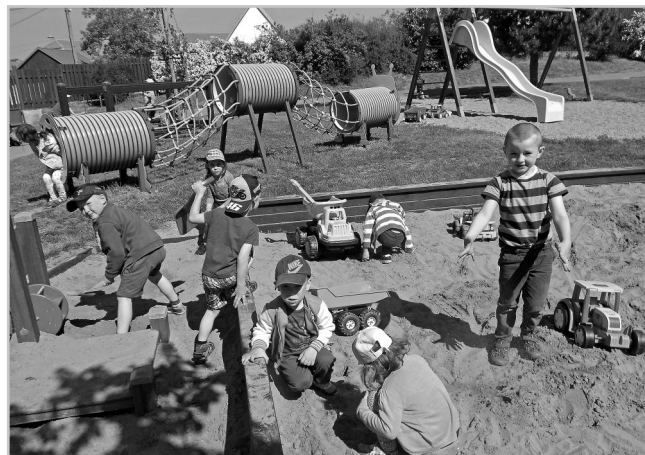
Na návštěvě v MŠ Vrbice.