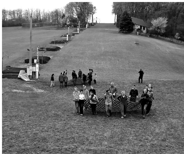
Úklid hmoty – „a je skoro hotovo“.

úkoly lyžařské školy – výuka proběhla jak ve víkendových kurzech, tak základních škol. Navíc se stalo již tradicí pořádání školy pro dříve narozené a různých školek pro nejmenší v průběhu prázdnin