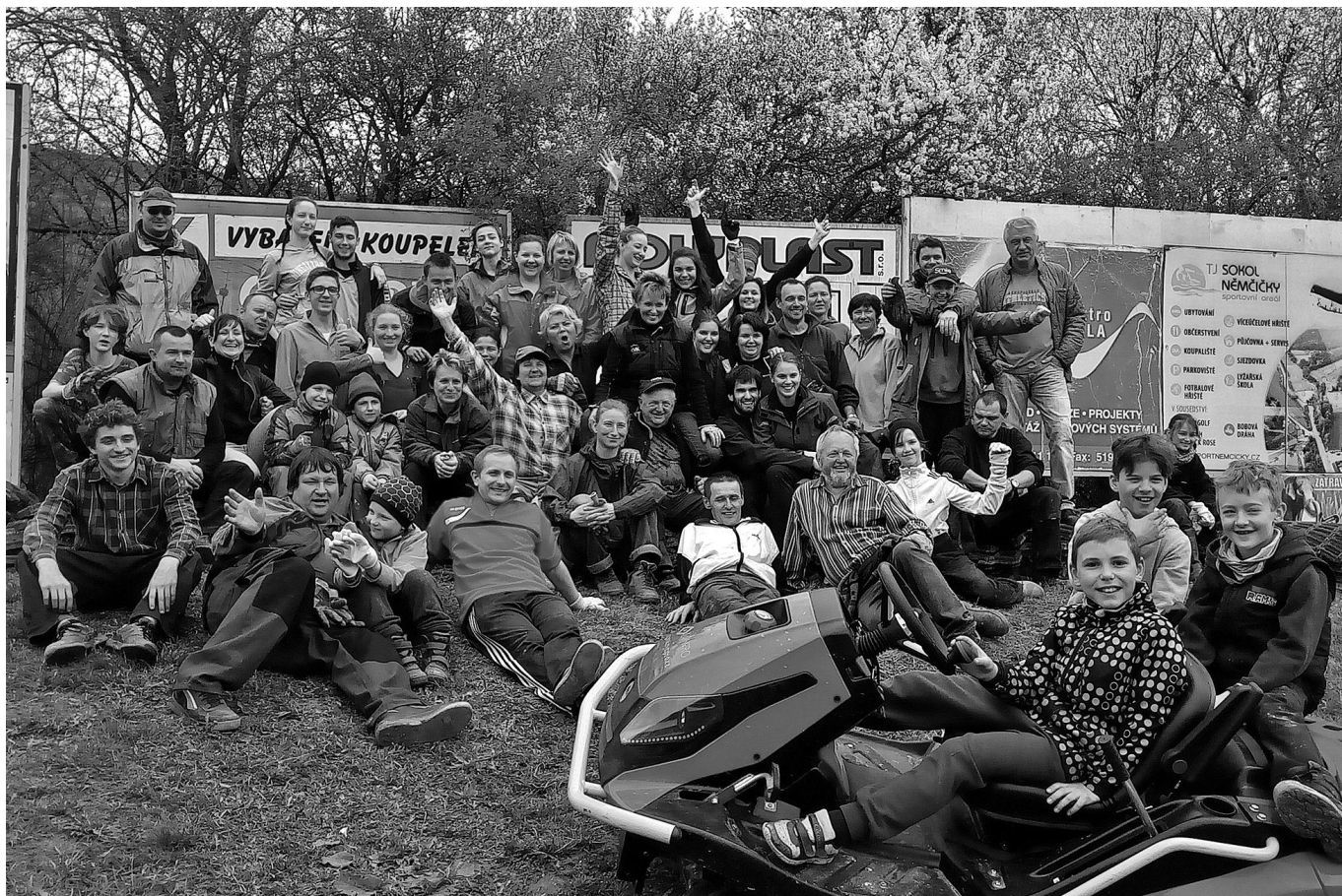
Úklid hmoty – radost po dokončeném úklidu svahu.