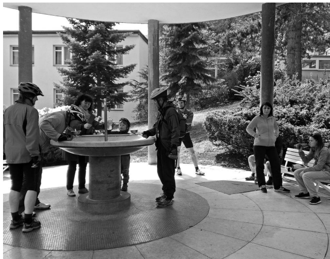
Cyklovýlet – zastávka v Teplicích nad Bečvou u Gallašova pramene.

Skončila zima bohatá na sněhovou nadílku, díky níž lyžařský oddíl TJ SPORT Někčičky mohl splnit nastavené