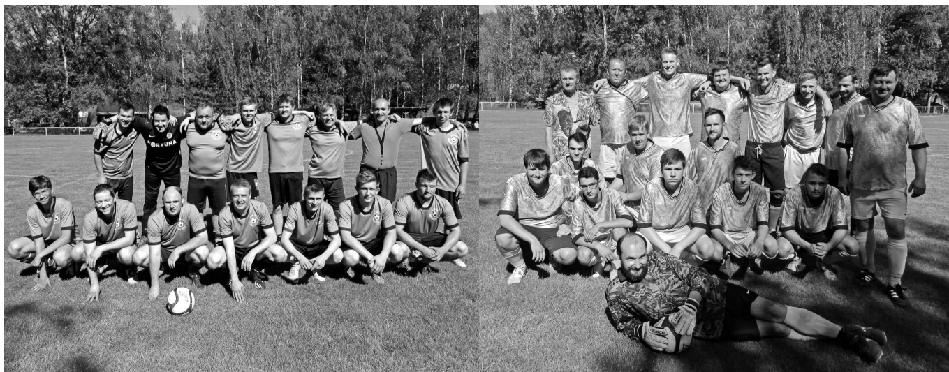
Mužstvo horní a mužstvo dolní.