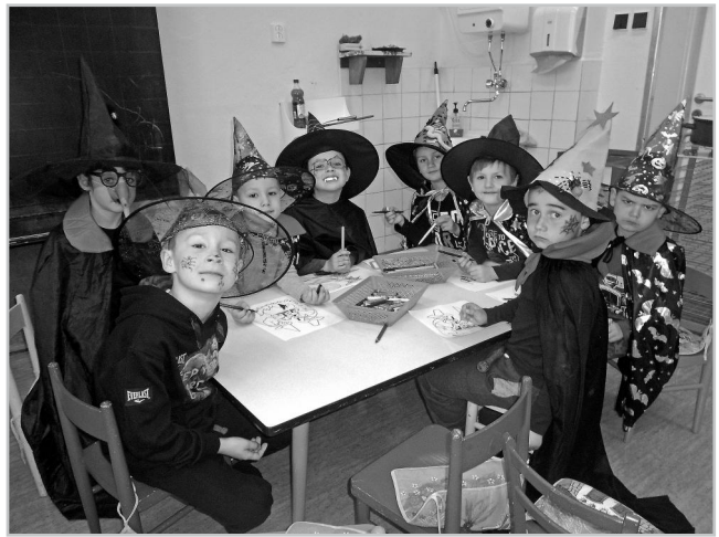
Čarodějové z MŠ.