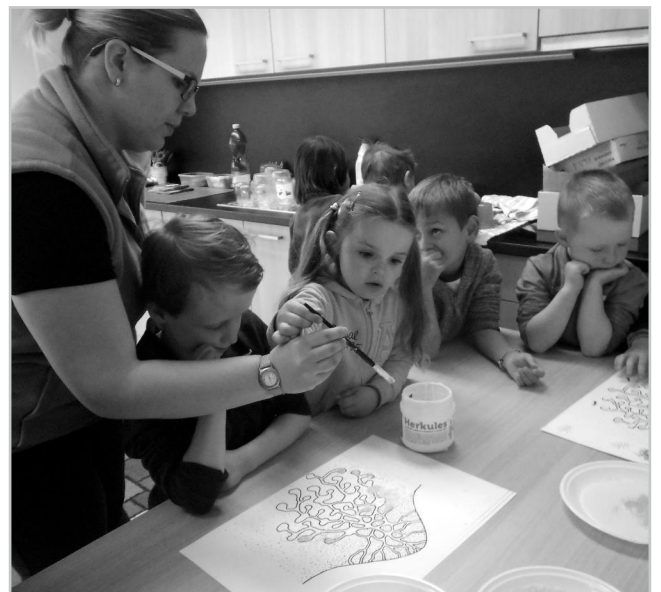
Výukový program „Ferda mravenec“.