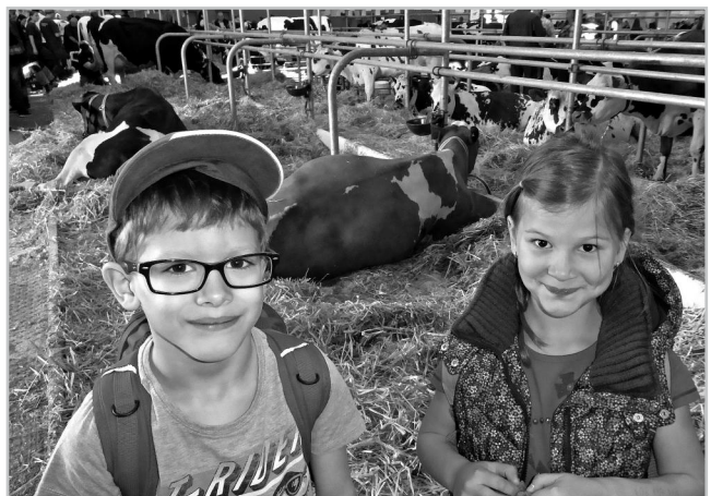
Žáci na výstavě zvířat.

Na výstavišti jsme pak měli objednaný program pro žáky základních škol, takže se nám dostalo i zasvěceného výkladu o jednotlivých druzích dobytka a dokonce i o mechanizační technice, používané ve velkochovech. Překvapilo nás, kolik barevných variant mohou mít různá plemena skotu a také