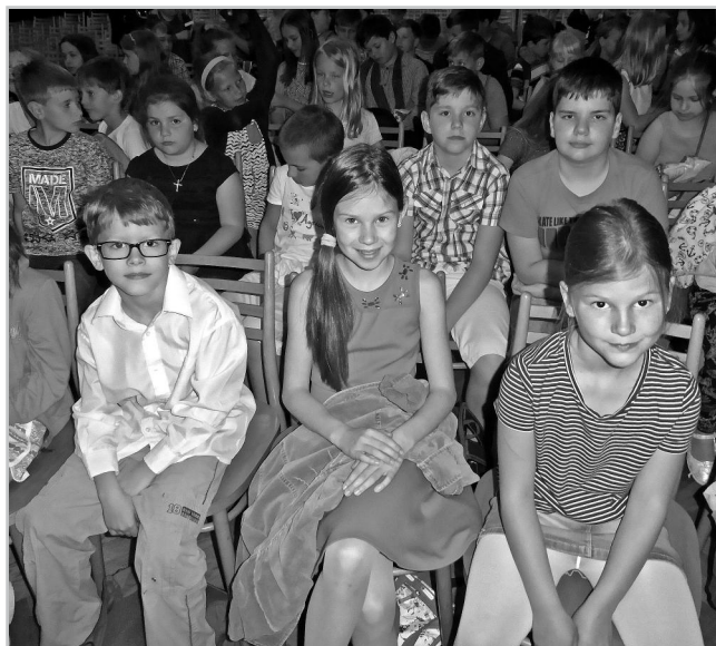
Děti v divadle.