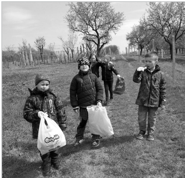
Den Země – sbírání odpadků.