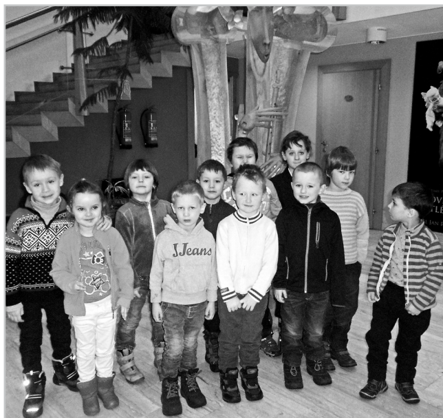
Děti v divadle.