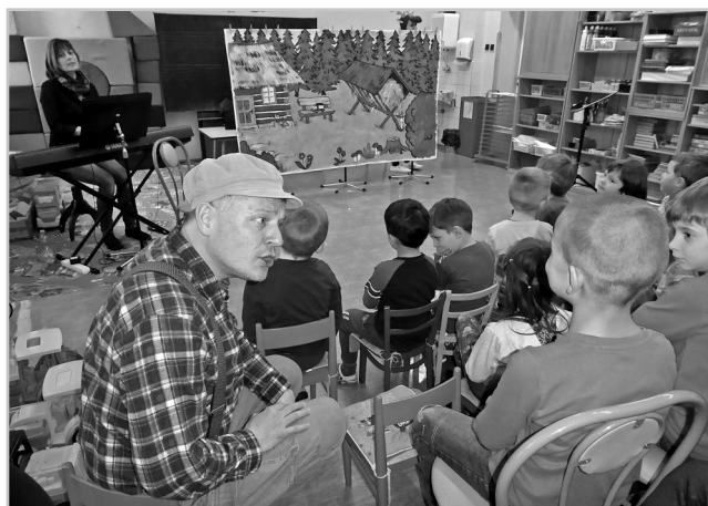
Pohádka O Smolíčkovi.