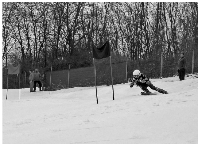
Z dění ve zkratce. Závodník na trati.