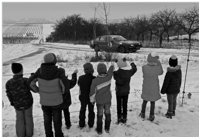
Fandíme na závodech.