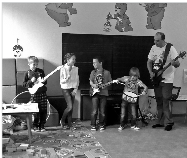
Hudební skupina „Metálci“.