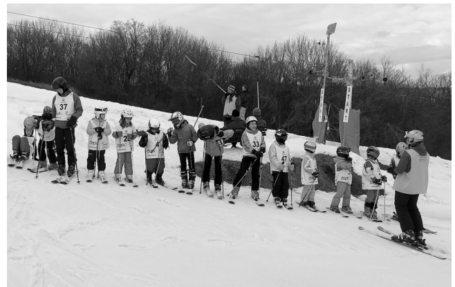
Příprava na prohlídku trati závodu.