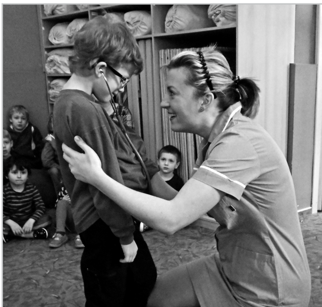
Návštěva zdravotní sestřičky ve školce.