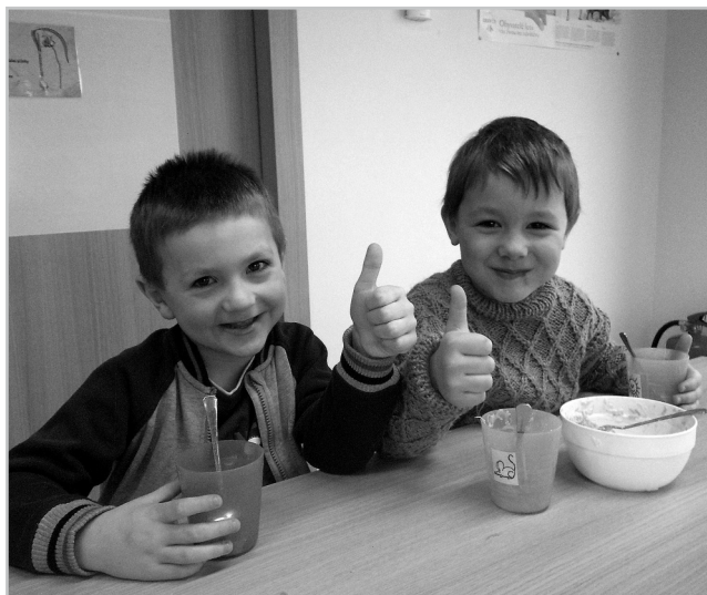
Česnekem nejen proti upírům.

Doma si můžete vyzkoušet zeleninový salát, který si děti samy vyrobily.