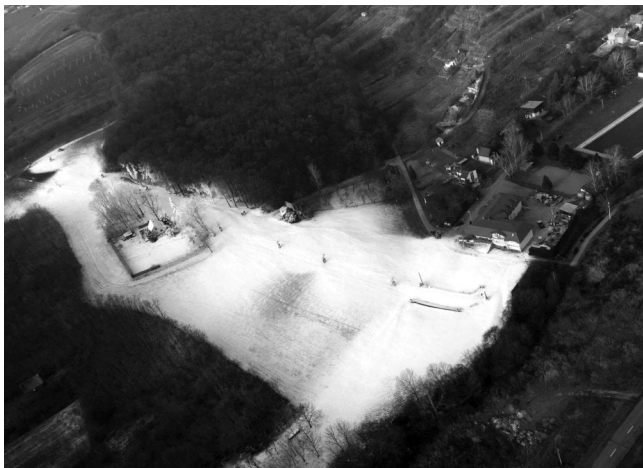
Pohled na zasněženou sjezdovku...

Před vlastní výstavbou vleku byl osloven Slovenský podnik Tatrapoma se žádostí o výrobu němčičského lyžařského vleku. Ten žádosti vyhověl a tak se koncem roku 1986 konečně začalo lyžovat! Sice jen s jednou buňkou, která sloužila jako občerstvení a s jedním sněhovým dělem, ale s velikou radostí a s nadšením.