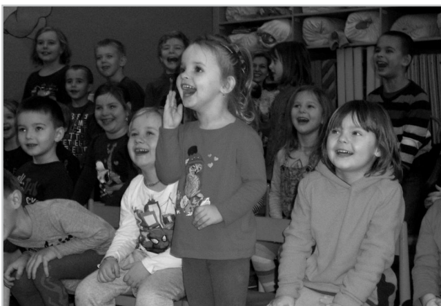
Dětem se Čabík moc líbil.