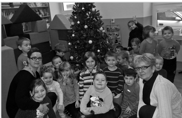
Školčátka u stromečku.