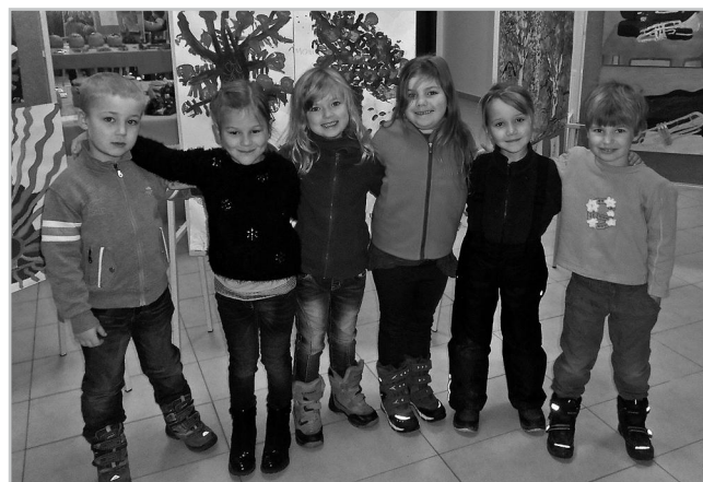
Děti na koncertě.