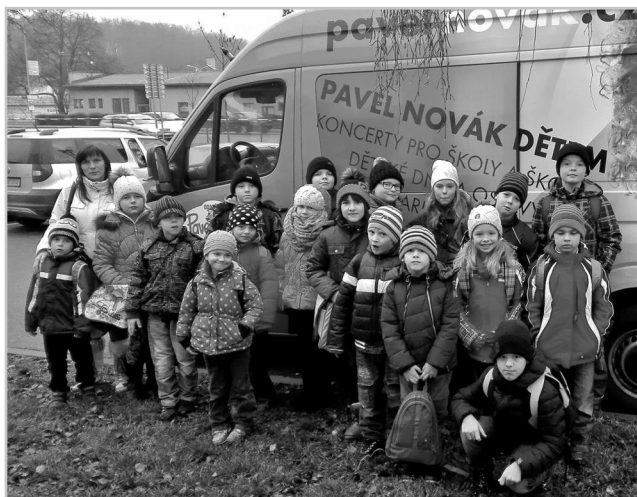
Děti na výletě - koncert Hustopeče.