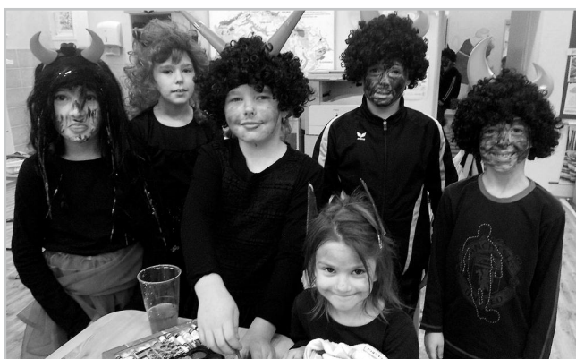
Čertíci ve škole.