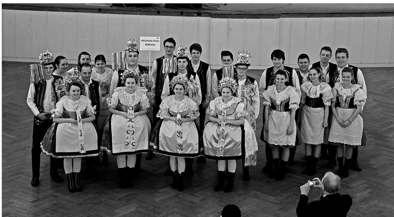
Krojovaná chasa na Moravském plese v Praze, 20. února 2016.