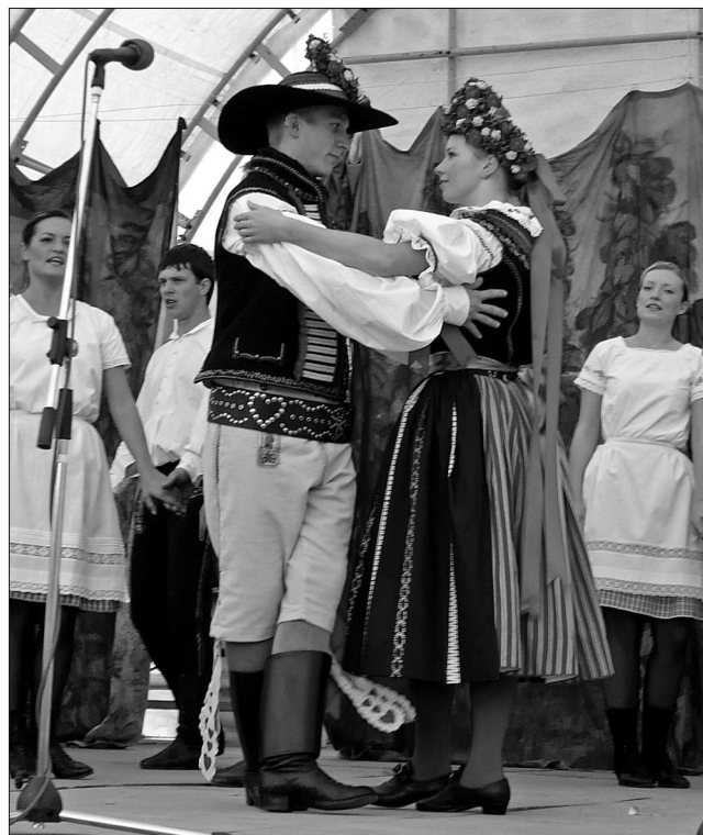
Vystoupení FS Zavádka z Čejkovic v Hustopečích.

prvnímu v regionu, beru to za první vlašťovku, která vyletěla střemhlav současným projevům, příkladně následovali i další nadšenci z řad folklorních souborů a to FS Salajka z Dambořic a členové z řad FS Ždánice ze Ždánic. Velmi důležitý byl i zájem nadšenců z řad nesouborové folklorní veřejnosti, kteří postupně vnímali tento rekonstruovaný kroj jako skutečné a pravdivé poohlédnutí do období, kdy lidový kroj ve svém vzhledu a funkčnosti měl své logické opodstatnění a vyjadřoval osobitost nositele, jeho projev a také sounáležitost ke svému okolí. Sám jsem si v roce 2011 nechal pořídit rekonstruovaný kroj z vlastních finančních prostředků s důkladným a detailním dohledem při výrobě s kolektivem muzea v Hustopečích