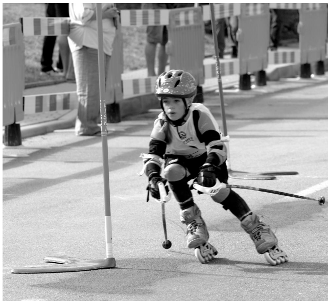
In-line Alpine Slalom - dětská odvaha.