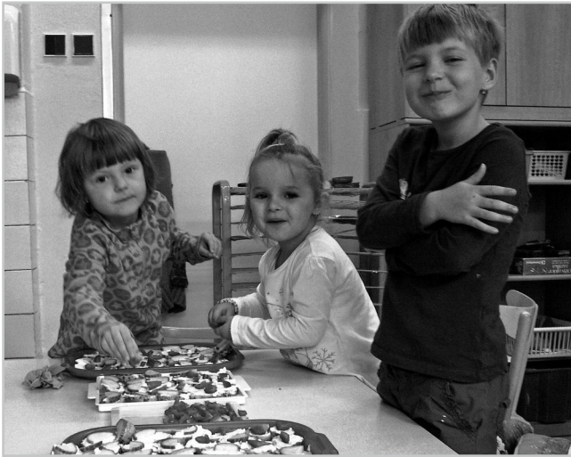
Děti z MŠ kuchtí.