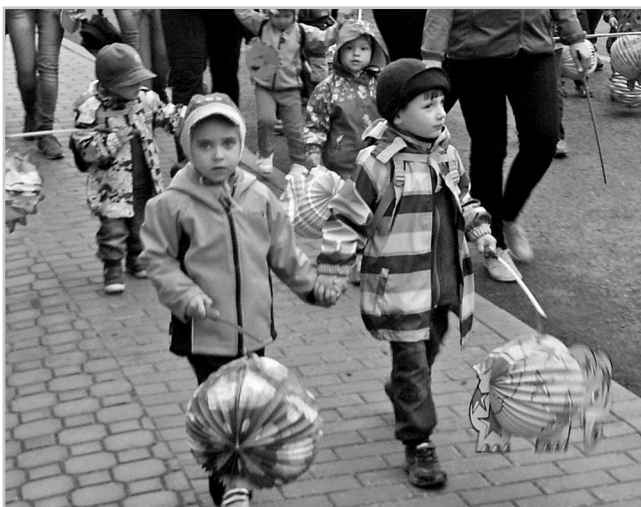
Pochod světlušek - průvod na bobovku.