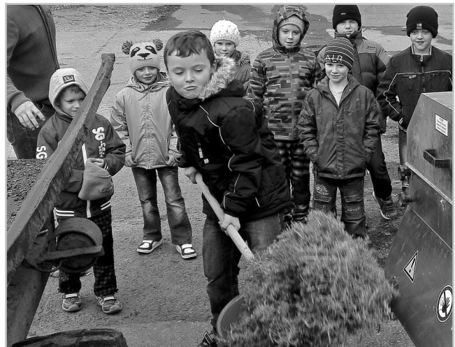
Žáci si vyzkoušeli i práci vinaře.