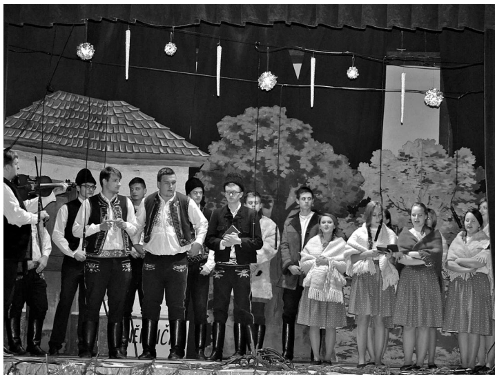
FS Krůžek na Vánočním jarmarku.

Doufám, že i ten nadcházející rok bude stejně tak úspěšný, jako ten letošní a to nejen pro nás, ale i pro Vás, naše příznivce. Za celý soubor se rozloučím veršem koledy, kterou jsme letos zpívali: