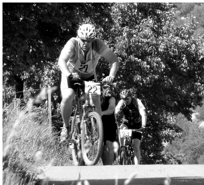
Triatlon - ...přece to vyšlapu.

Celkem 34 mužů, 5 žen a 12 dětí se sešlo na startu 7. ročníku tohoto závodu v sobotu 6. června. Teplota vody byla v letošním roce rekordní, když dosahovala téměř 21 °C. I počasí přálo a tak bylo zaděláno na pěkné výsledky – mezi muži padl traťový rekord. Nejrychlejší závodníci zvládli celou trať 200 m plavání, 20 km na kole a 4 km běhu za necelou hodinu – přesně 58 minut a 22 sekund.