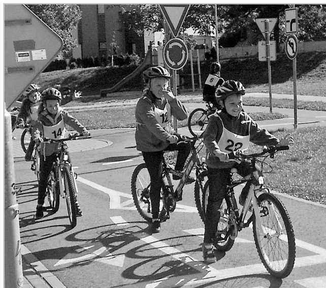
Žáci na dopravním hřišti v Hustopečích.