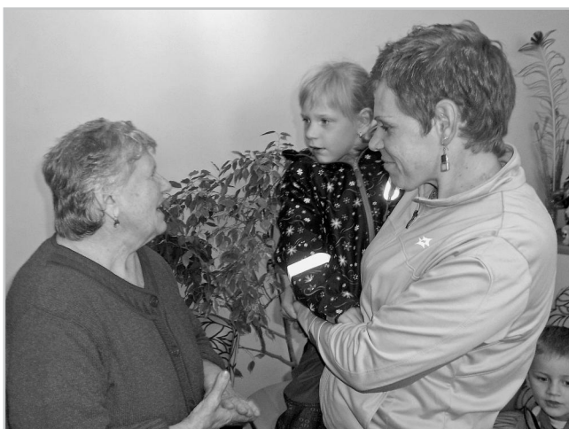
Děti přály seniorům vše nejlepší.