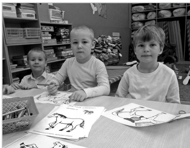
Oslava svátku svatého Martina.