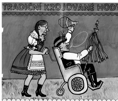
Letošní pozvánka na bořecké hody.

Proti nám jsou Bořetičtí poněkud zvýhodněni, a to železnými kolejami, které k nim přivádějí měšťáky do Kravích hor. Tento sklepní areál od nepaměti utváří zvláštní národu Bořečáků. Němčičák, který dostane chuť na pár hltů vína, udělá něco kroků na dvoře a je ve svém sklepě. Bořečák se k tomu obřadu musí ustrojít, vzít do ruky sotúrek a vydat se do sklepa pod Kraví horu. Možná z těchto důvodů některého i chuť přejde. Jiný raději vezme k naplnění raději demižón, aby do Kravích hor nemusel tak často vážit cestu. Ještě horší to měli jejich dávní předci. V místech dnešní Trkmanky