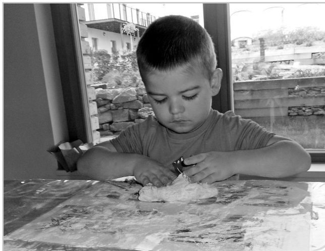
Děti si upekly chlebové bochánky.