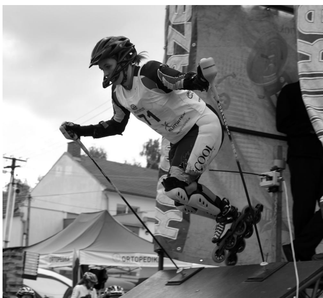
In-line Alpine Slalom - pořádně odstartovat.