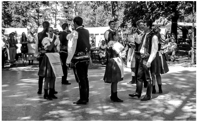
Obrázek vpravo: Vystoupení FS Krůžek Němčičky ve Starovicích na prvním Setkání přátel jižní Moravy.

V sobotu 1. srpna 2015 jsme se zúčastnili historicky prvního Setkání přátel jižní Moravy, které se uskutečnilo ve Starovicích na Břeclavsku. Součástí byla přehlídka krojů a ochutnávka vín napříč jižní Moravou. Byli jsme účastníky velkého krojovaného průvodu a předvedli jsme zde naše pásma z regionu Hanáckého Slovácka. Doprovázela nás CM Lašár.