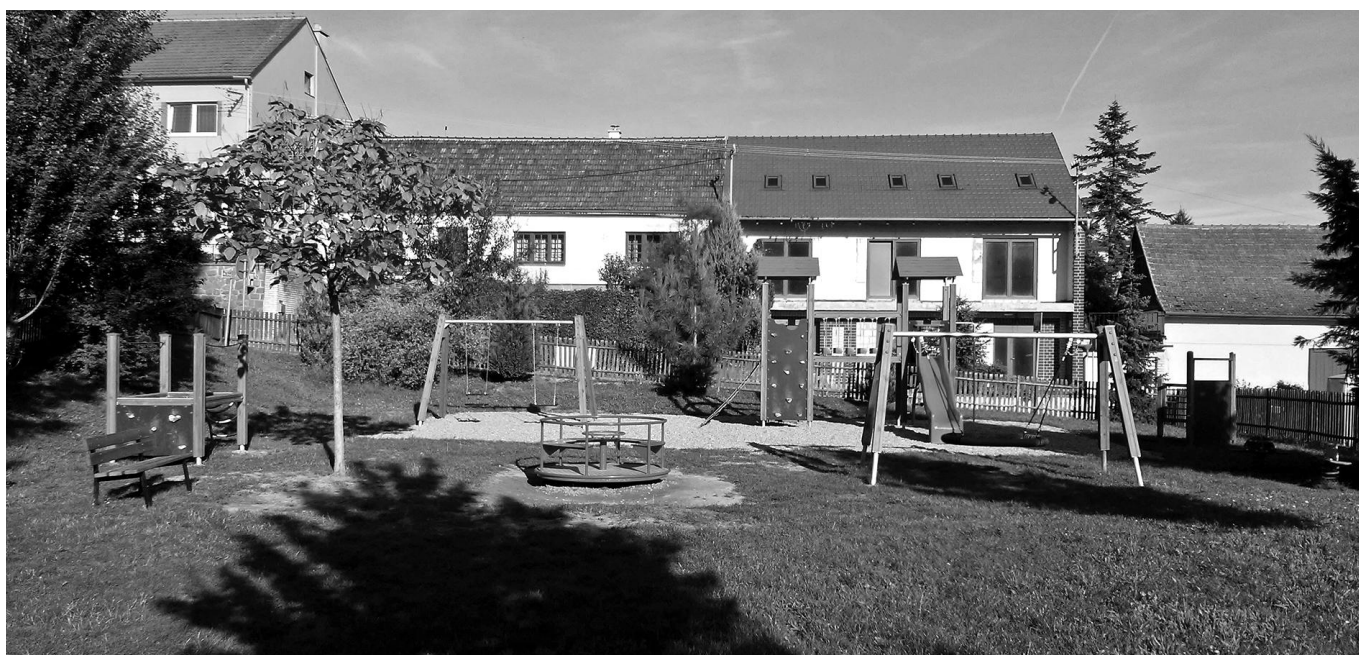
Dětské hřiště v novém kabátě.