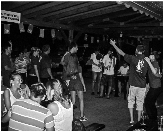
Folklórní středa s CM Lašár - 12. srpna 2015, tentokrát na koupališti.

Již během loňských prázdnin jsme se s některými z Vás setkali při středečních besedách u cimbálu, které byly pořádány za pomoci občerstvení Bobovka.