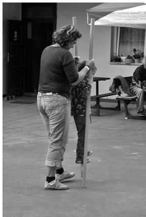
Jednou z her byla i chůze na chůdách.