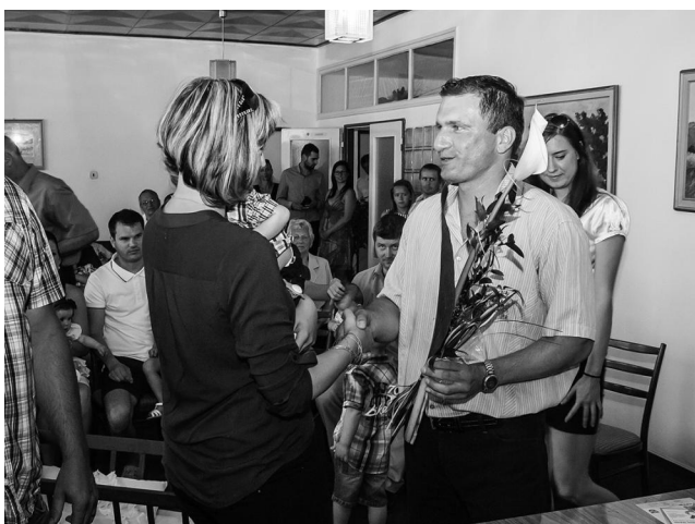
Gratulace a předání drobných dárek rodičům.