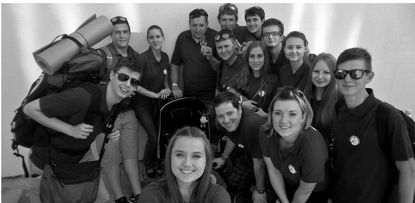
Členové FS Krúžek Němčičky na MFF letos ve Strážnici.