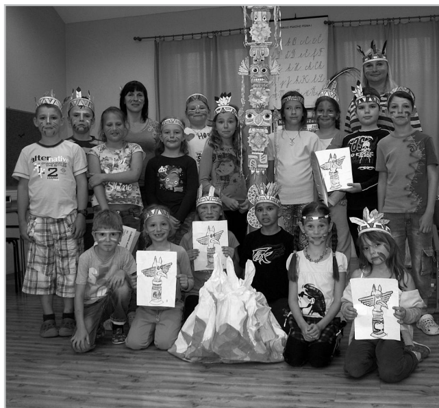
Indiánské kmeny u totemu.

Po rozlosování do indiánských kmenů si děti pomoci barviček na obličej vytvořily krásná originální zdobení „indiánů na válečné stezce“, nastrojily se do indiánských čelenek, které si už dříve vyrobily a na internetu si vyhledaly svoje indiánské jméno. Tím absolvovaly disciplínu „Indiánská kosmetika“, jež byla první v řadě soutěží, které byly pro naše indiány připraveny.