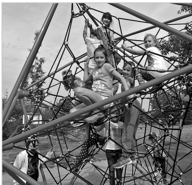
Děti v parku u planetária.