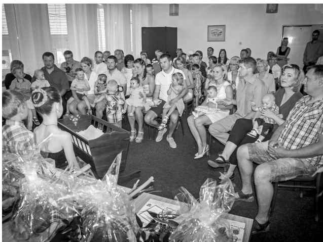
Vitali jsme pět malých občánků.