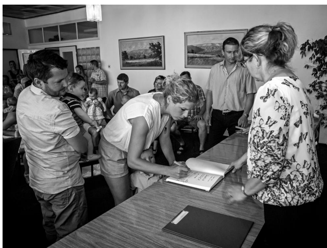
Slavnostní zápis o uvítání do života do kroniky obce.