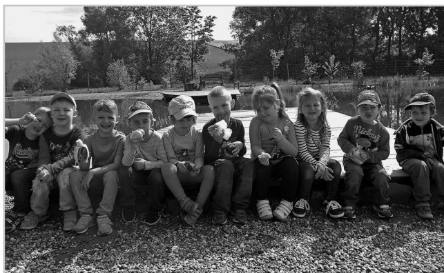
Školčátka na výletě.