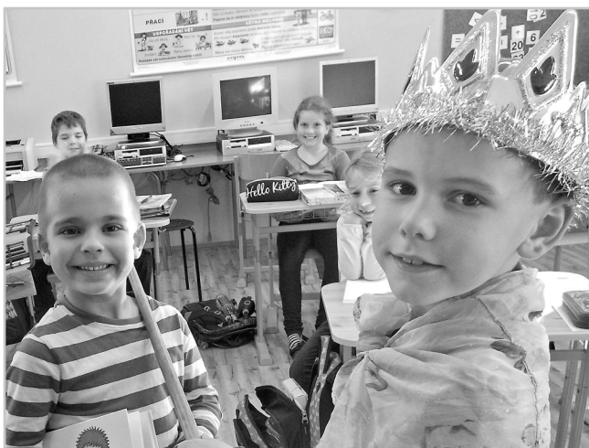
Pasování na čtenáře.