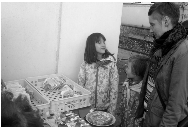
Prodej misijních koláčů.

Peníze byly odeslány na účet Papežských misijních děl a letos budou použity na pomoc více než 63 tisícům sirotků, nemocných, hladových či jinak strádajících dětí ve 23 diecézích a 9 zemích.