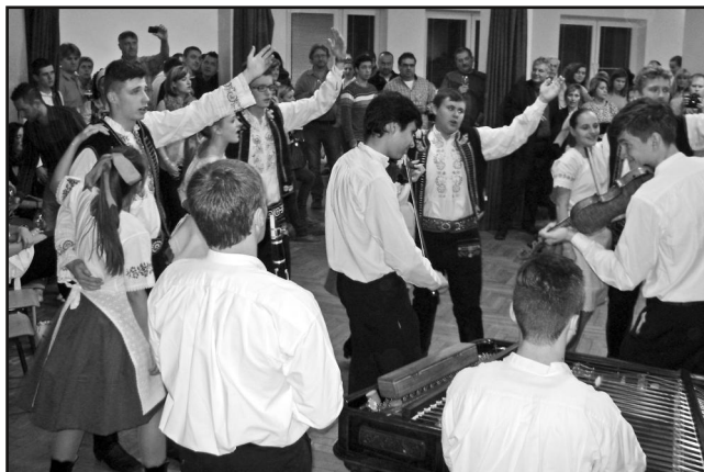
FS Krúžek na Svatomartinském koštu.

Za peníze si ženy vyhradily ale stejná práva jako muži. Ti totiž seděli u kamen, na lavicích podle stěn, před okny a ženy je vyzývaly k tanci. Byly to skotačivé