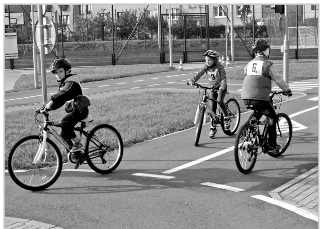
Děti na dopravním hřišti v Hustopečích.