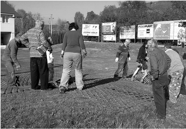
Na obou fotografiích - příprava sportovního areálu na zimní sezónu.