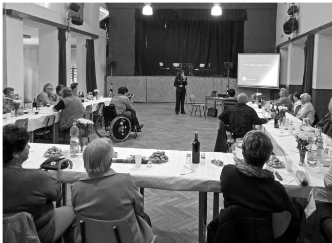
Nedělní odpoledne - přednáška Policie ČR.

„Velmi se nám tady líbilo, zvláště mladí hudebníci.“