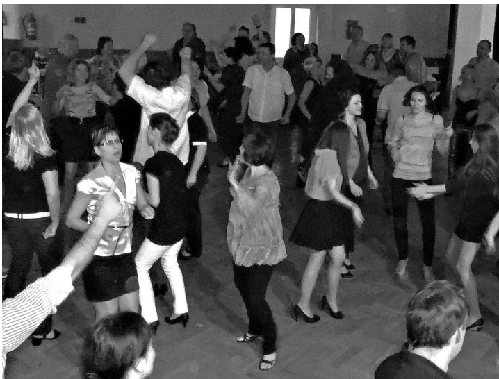
Letošní ples pořádaný Sdružením nezávislých kandidátů.

Rád bych pro všechny ty, kteří mají zájem o dění v naší obci a nemohou se veřejného zastupitelstva účastnit osobně, jsem ochoten Vám odpovědět na případné otázky na e-mailu: zbynek.slezak@seznam.cz