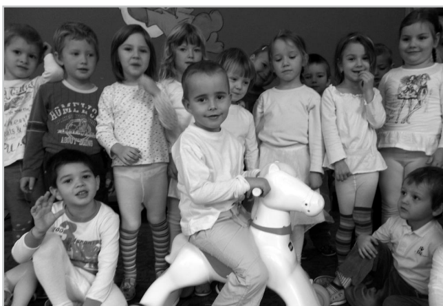
Oslava dne svatého Martina.