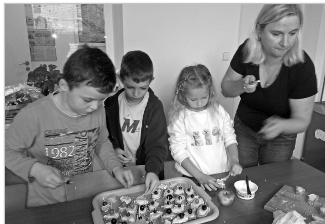
Den zdravé výživy.