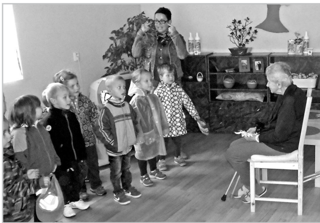
Den seniorů - oslava na domovince.