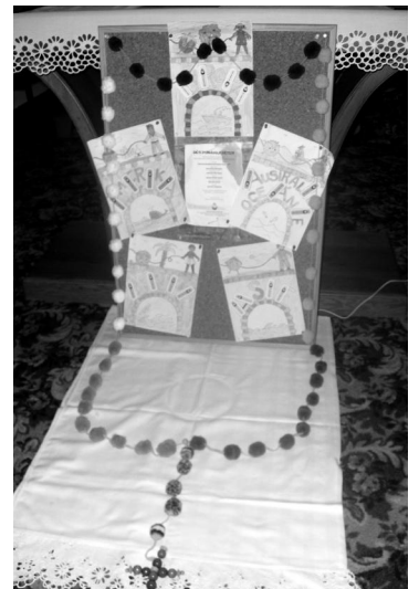
Misijní růženec.

Výtěžkem z misijních akcí a darů hradíme totiž 80 projektů Papežského misijního díla dětí např. v Papui-Nové Guineji, Keni, Ugandě a na Filipínách. Například v Ugandě naše dary dostane 32 371 dětí v bídě, kde přispějeme k záchraně života obětem únosů a nemoci AIDS, budeme se podílet na zajištění nádrže na vodu, na stavbě mateřské školky a školních tříd, lékařské péči, chodu dětského domova a vzdělání opuštěných sirotků.