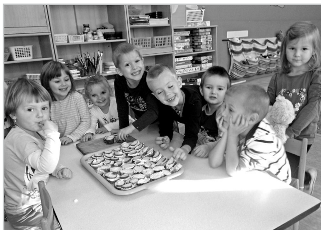
Den kuchařů v MŠ.