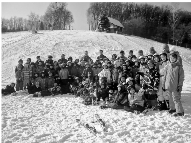
Účastníci lyžařského kurzu ze ZŠ Kamaňky.

V Němčičkách se děti nadšeně vrhly na svah, přestože pro většinu z nich bylo lyžování na umělé hmotě novinkou. Nadšení je neopustilo po celý týden a pod vedením opravdu trpělivých instruktorů houževnatě pilovaly techniky. A to jak začátečníci, tak i ostřílení „mazáci“.