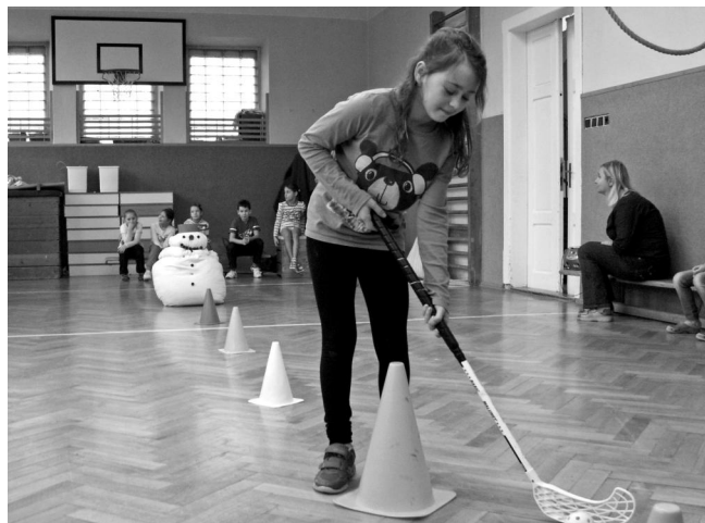
Olympiáda ve školním pojetí.