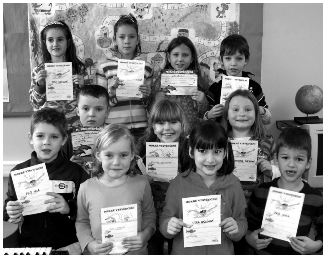
Žáci 2. a 3. ročníku obdrželi mokrá vysvědčení.