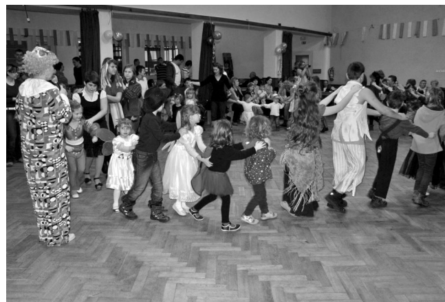
Dětský maškarní karneval - tanečky.