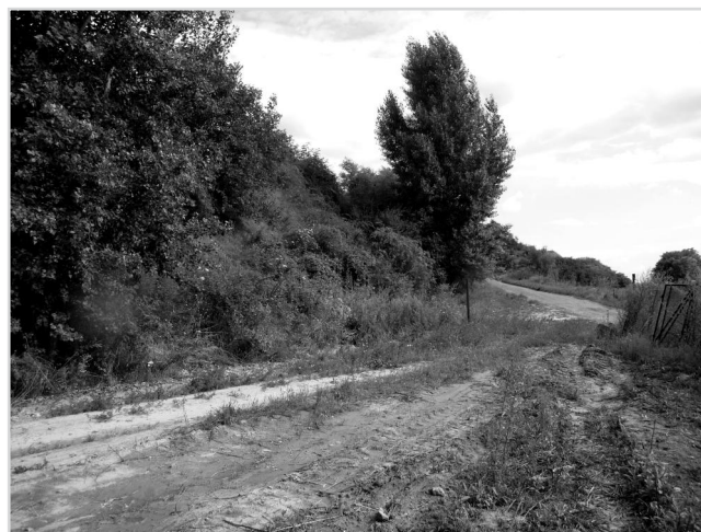
Dříve neudržované meze.

Po vysazení vinohradu na terasách u rybníka, nastal problém, co s neudržovanými mezemi porostlými šípkovými keři a akátem. Začali jsme je tedy osazovat malými