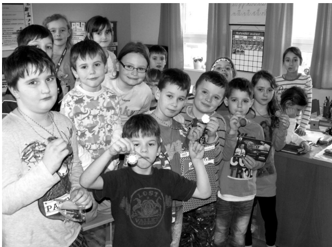
Vyhráli jsme medaile.

Ve středu 12.2. jsme si zkusili prožít atmosféru olympiády a v rámci tělesné výchovy jsme si vyzkoušeli tyto disciplíny: hokej, biatlon, skok do dálky, rychlobruslení, curling, sjezdové disciplíny. Všichni z nás