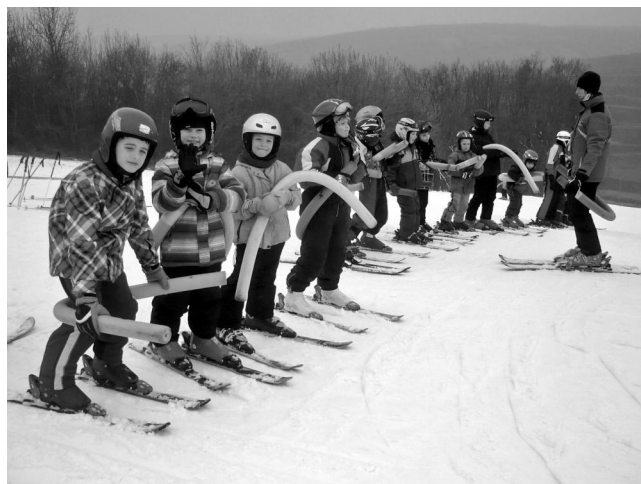
Lyžařská výuka žáků ze ZŠ Kamaňky.

http://www.zskobyli.cz/index.php?akce=10001&id=995&limit=