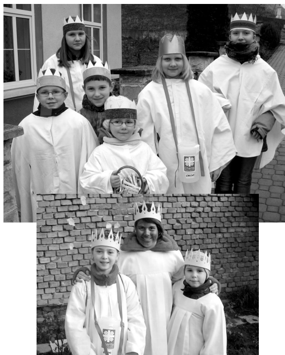
Koledníci tříkrálové sbírky. Na horní fotografii koledníci v Horních Bojanovicích.

Také v letošním roce se v naší obci konala Tříkrálová sbírka. Letos jsme zahájili koledování tak trochu netradičně, protože nás požádali o pomoc ze sousední obce a tak se jedna naše skupinka vydala koledovat do Horních Bojanovic 4.1.2014 a za týden už jsme koledovali u nás. V Němčičkách se vybralo krásných 16 023 Kč a samozřejmě každý koledník si odnesl i nějaké ty sladkosti, na které se už těšili. Děkujeme všem dárcům a také koledníkům.