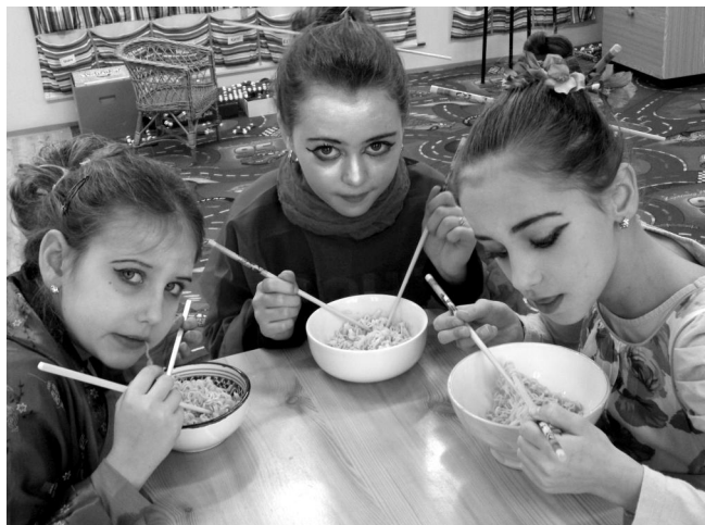
Dny s Asií - ochutnávka tradičních pokrmů.

Cílem projektu bylo uvědomit si odlišnosti lidí různých ras, vnímání jejich kultury, stylu života, oblékání, zábavy a tradičních pokrmů. Žáci si již od prvního dne nosili potřebné věci (misky, hůlky, obleky...), aby si poslední den mohli užít ve vsí paradě.