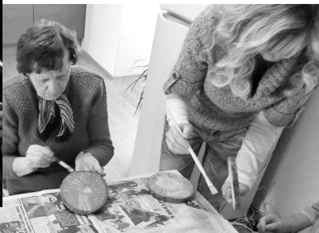
Pracovní aktivity na Domovince.